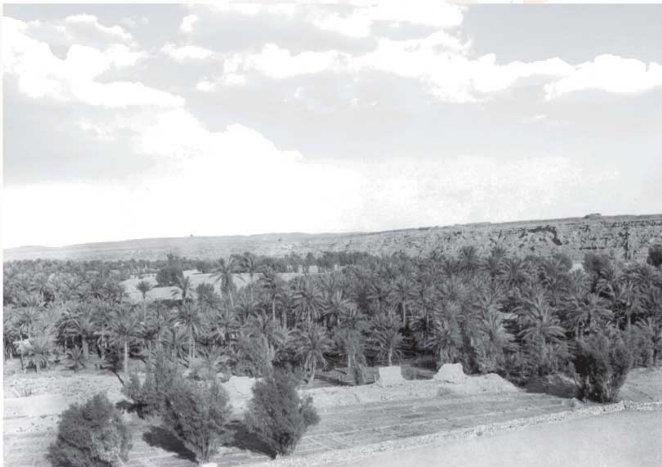
صورة تاريخية لوادي حنيفة، ١٣٣٥هـ / ١٩١٧م