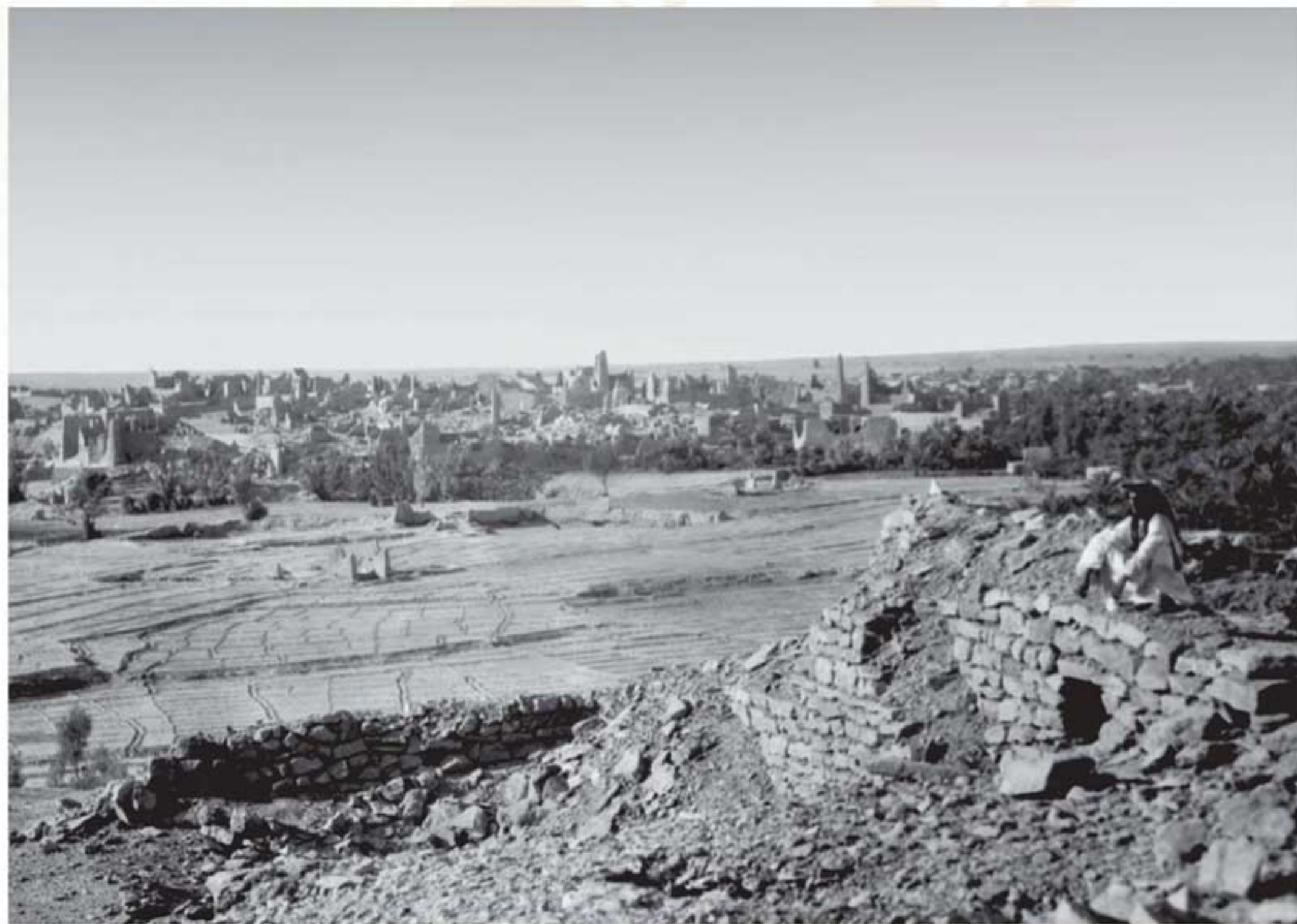
أطلال حي الطريف، ١٣٣٥هـ / ١٩١٧م