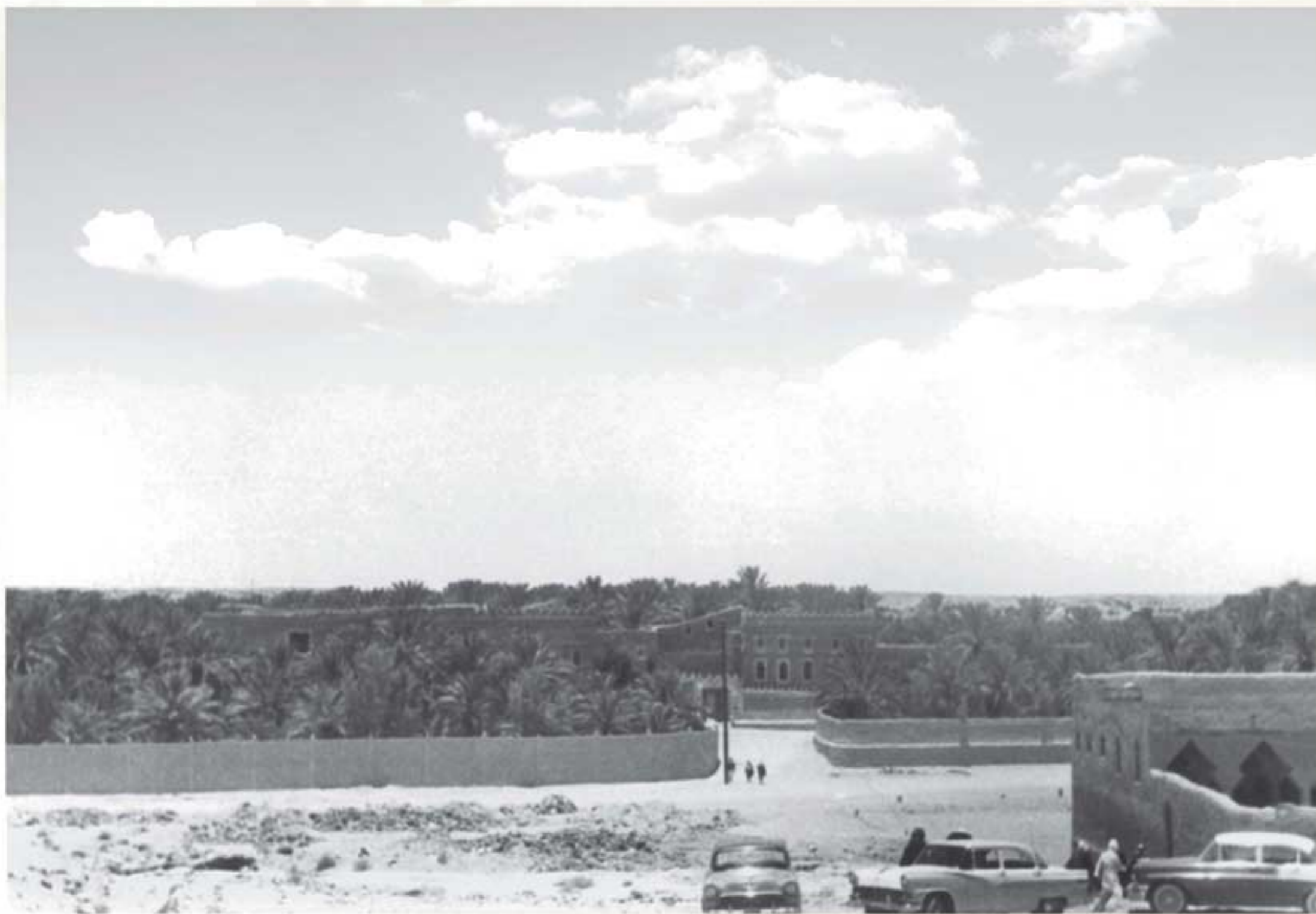
قصر البديعة، ١٣٧٦هـ / ١٩٥٦م