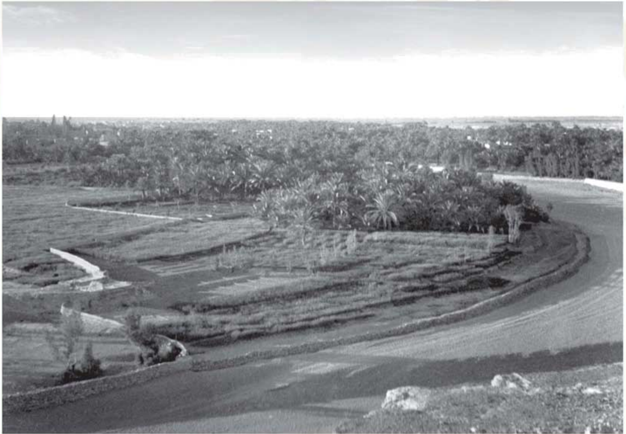
صورة تاريخية لوادي حنيفة