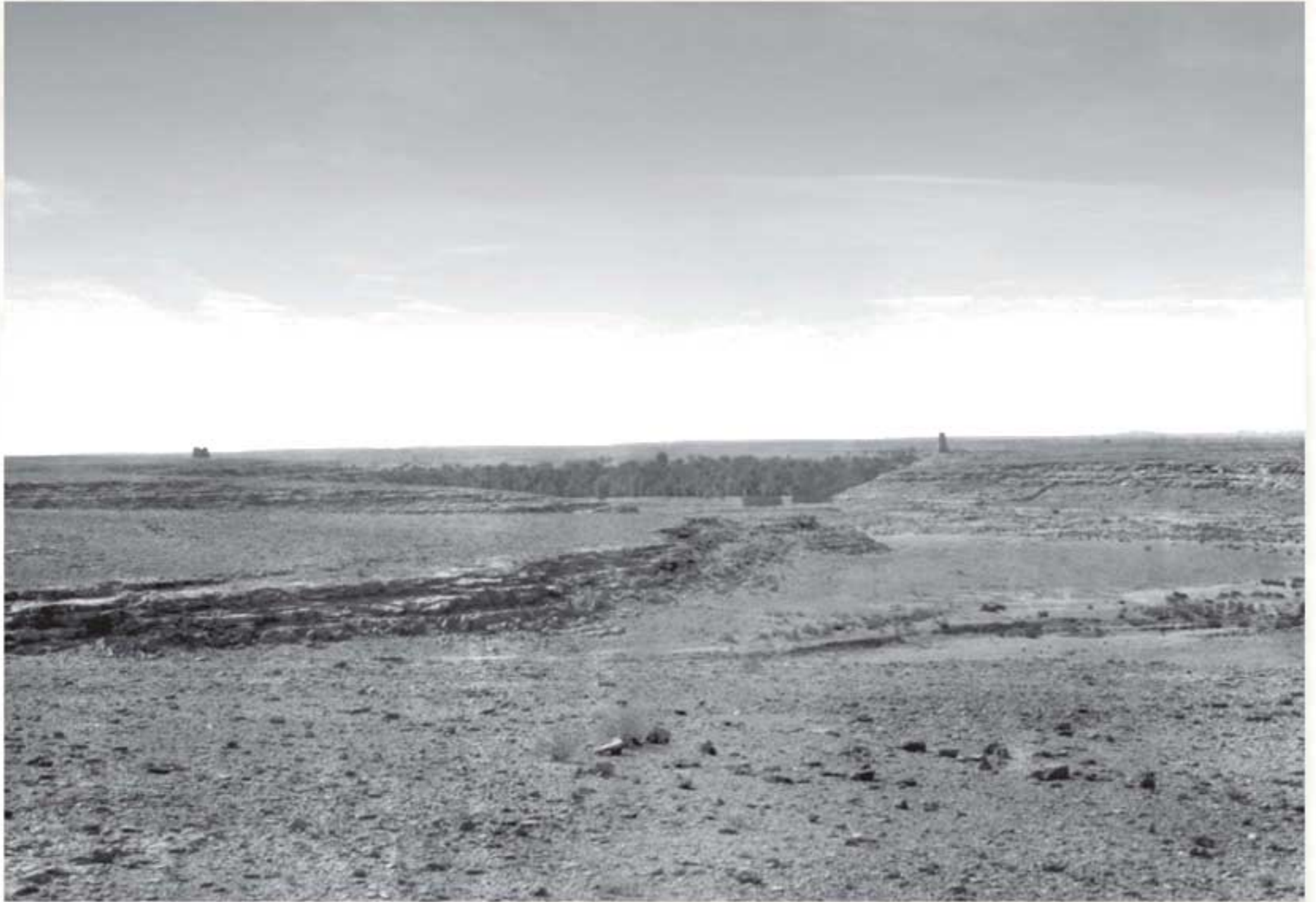
صورة تاريخية لوادي حنيقة، ١٣٣٥هـ / ١٩١٧م